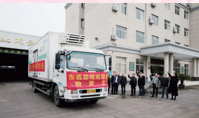
载满“鸡冠雪梨”芥菜种子及配套农作用物资的卡车

由浙农集团内有关单位联合发起成立的浙农精准帮扶基金,本金规模达2000万元,用于转变帮扶扶