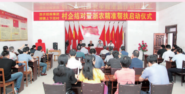
浙农集团与上下范村村企结对暨浙农精准帮扶启动仪式

2018年底,龙游柑桔产业精准帮扶技术研讨会顺利举行,通过“授农以技”,提高了橘农的种植技艺,促进了当地柑桔产业转型升级。而在离会场不到40分钟车程的上下范村金秋红柑桔专业合作社,上千平方米的库房里,黄绿色的鲜果堆成了山,浙农提供的农资供应、技术服务等帮扶手段,让这里的农户尝到了精准帮扶带来的甜头。合作社相关负责人介绍,按照浙农提供的帮扶方案,幼树长势很快,果实成熟早,品相也更好,一个新品种果子的利润就抵得上原来几百个椪柑。